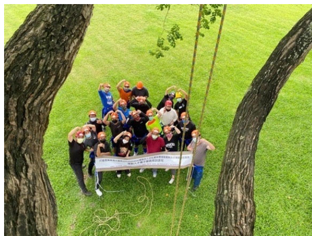
圖 15：種子學員培訓課程

本計畫實施場域於南投縣信義鄉濁水溪線之地利村、潭南村、雙龍村及人和村等四個部落，透過南投縣政府於先期計畫階段的整體山林資源盤點調查，以及各部落的內部共識討論，引進定向越野、溯溪、高低空垂降及攀樹等活動，企圖結合部落山林資源，打造「整座部落山林都是原味體驗的遊樂場」之願景目標。順應著體驗經濟盛行的潮流，這樣的產業主題定位，在當今的部落休閒旅遊產業裡面，是非常具有特色及區隔性的；也期許這樣的產業模式，可以吸引更多青年留鄉及回鄉，讓部落更有向上發展的原動力。