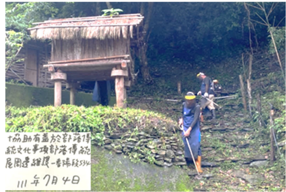
圖 12：南投縣仁愛鄉公所生態資源維護隊員執行協助有益於部落傳統文化事項工作情形。