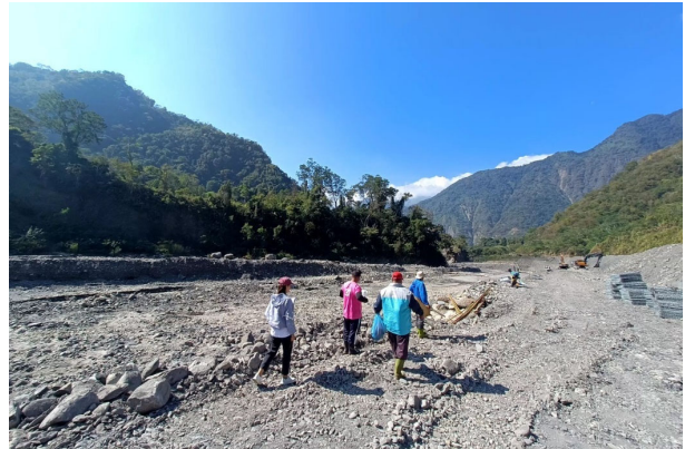
圖 5：高雄市桃源區公所隊員執行部落山川資源維護工作情形。