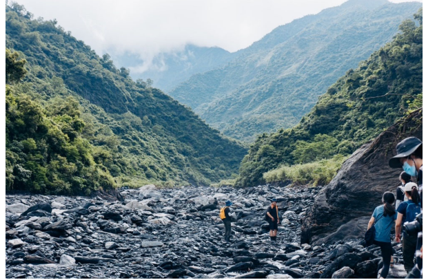
圖 17：戶外空間遊憩體驗

來義鄉以豐富的山林資源與文化資產為基底，發展戶外休閒旅遊產業。期望依據各部落的產業資源現況與屬性，將全鄉「綜合發展及低強度戶外體驗空間」、「高強度戶外體驗空間」及「後勤整備生產暨農事體驗空間」等三種空間，進行不同的體驗遊程規劃及軟硬體條件強化等推動工作，同時也把遊客分眾分群，未來可以針對不同目標客群進行更有效的行銷廣宣。