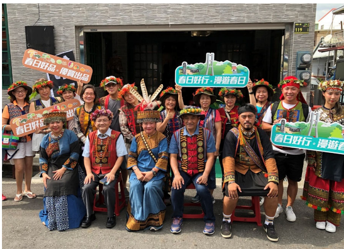
圖 16：七佳部落收穫祭結合文化旅遊 漫遊浸水營古道

屏東縣春日鄉公所在本會的資源支持下，自 108 年推動「春日好行」農產品牌，主打鄉內優質（有機及無毒）的農產品，結合「浸水營古道」及「老七佳石板屋聚落群」等文化資產的深度遊程，共同推廣鄉內的農產及山林資源。本期計畫則延續前期計畫成果，進一步推出「春日好行」作為旅遊品牌，將「力力溪伏流水圳」、「傳統祭儀」及在地食農體驗納入遊程規劃，並輔導鄉內族人提升交通接駁與住宿量能，以「在地文化體現」、「健康環保優