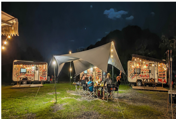
圖 13：那山那谷有限公司（宜蘭南澳）。

過去幾年扶植的原住民族企業中，部分企業基於對原住民族山林知識保護、傳承的使命感，以發展山林事業為目標，落實山林知識及山野教育的擴展，如「那山那谷有限公司」(106 年百萬創業計畫入選團隊，圖 13) 是由泰雅族人在宜蘭南澳開立的露營區，此外，也提供山林知識導覽、溯溪體驗等服務。或是「台灣跑山獸有限公司」(104 年百萬創業計畫入選團隊，圖 14) 是由賽德克族人在南投埔里開立的籌辦路跑及越野跑賽事的公司，透過各類賽事結合原住民族部落與山林，並與國際接軌，讓數千位國際跑者藉由野獸山徑，進入部落、理解部落歷史、體驗部落生活，讓世界認識臺灣原住民族文化。