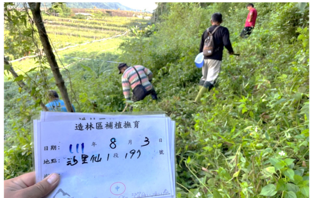
圖 7：南投縣信義鄉公所隊員執行造林區補植撫育工作情形。