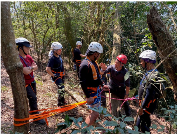
圖 18：原住民族山域嚮導訓練課程-基礎繩索

本會持續透過補助地方政府或民間團體辦理原住民族職業訓練計畫及公益彩券回饋金補助計畫，經統計 111 年共培訓 110 人、112 年共培訓 120 人從事山林服務、山域嚮導或文化導