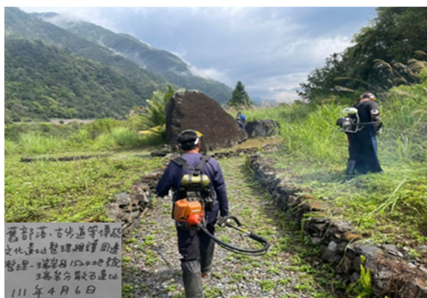
圖 2：南投縣仁愛鄉公所生態資源維護隊員執行瑞岩分散石遺址整理維護工作情形。

完成傳統古道及舊部落文化遺址地點資料建檔 62 處，整理維護工作路線累計里程 4,025.98 公里。