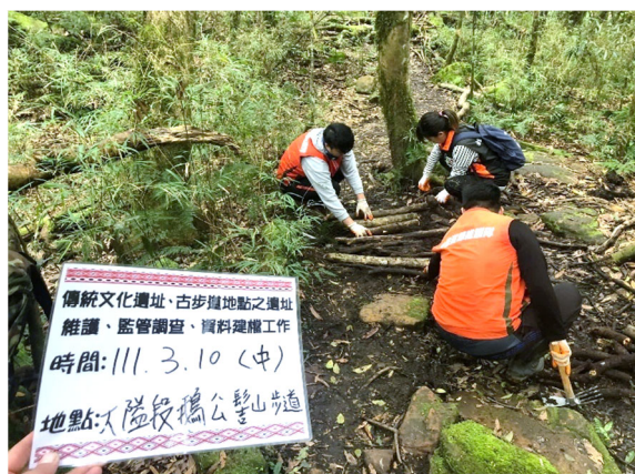
圖 3：新竹縣五峰鄉公所生態資源維護隊員執行大隘段鵝公髻山步道整理維護工作情形。