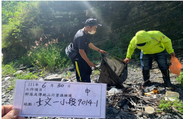
圖 4：屏東縣春日鄉公所生態資源維護隊員執行部落山川資源整理維護工作情形。