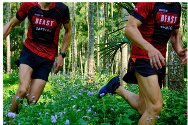
圖 14：台灣跑山獸有限公司（南投埔里）。