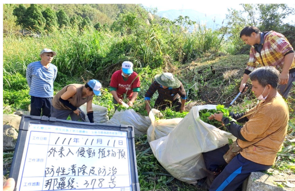
圖 8：新竹縣尖石鄉公所隊員執行外來入侵植物預防性清除工作。