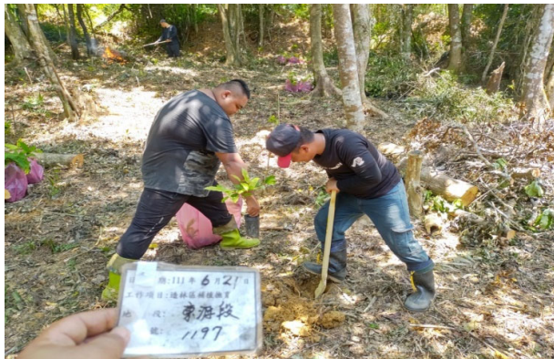
圖 6：屏東縣牡丹鄉公所生態資源維護隊員執行補植造林工作情形。