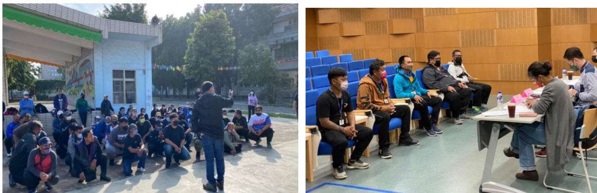
圖 1：屏東縣政府辦理計畫人員體能考試、面試現場情形。